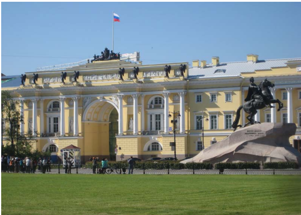
Schloss Peterhof (oben) und Admiralspalast mit dem berühmten Denkmal von Peter dem Großen (unten)