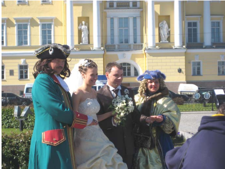
Hochzeit in St. Petersburg