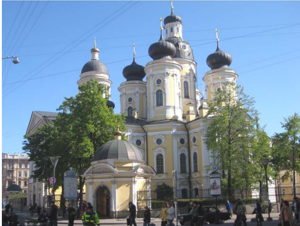
Russisch-orthodoxe Kirche im Stadtzentrum von St. Petersburg